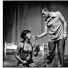
Día: hoy jueves/20 horas.

"Funeral de la nada" de la compañía colombiana Sueño Mestizo, pertenece al género del teatro danza y abrirá esta noche el Encuentro Internacional de Teatro para Chillán.