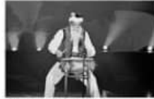
Teatro a Mil llega a Chillán.

Dos obras de teatro montará en Chillán la tradicional actividad santiaguina Teatro a Mil. Se trata de "El encanto del Río Amarillo" (Selección Internacional, China) este 25 de enero; y de "Dragones", (Selección Internacional, España) que se presentará este 26 de enero.