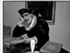
Día: mañana viernes/12 horas.

Los fuegos los abre la comedia argentina "Chicos en banda" de la compañía La Juntada. Se trata de un texto escrito por el mismo colectivo.