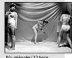
Día: miércoles/12 horas.

A las doce se presenta la argentina "Un poquito nada más" de la Compañía argentina Modus Vivendi. A las 20 horas "Strangenos" con la compañía Labirinto de Brasil. La ceremonia de clausura se efectuará a las 21 horas, para luego dar paso a la obra que cerrará el encuentro. Se trata de "Miocarditis" de la compañía chilena Teatro la Sombra de la Memoria.